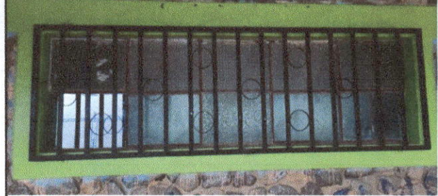
Foto 2: Sustitución de estructura de metal mas vidrios en aulas modulo 1