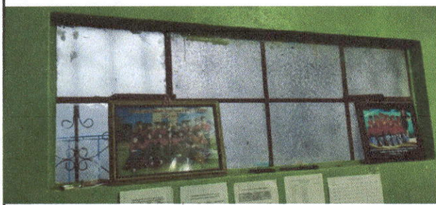
Foto 3: sustitucion de estructura de metal mas vidrios en Dirección